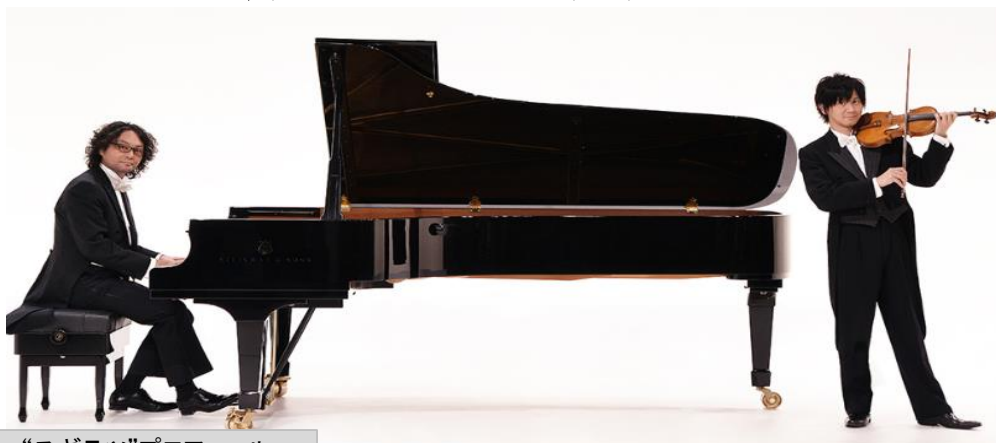
“スギテツ”プロフィール

本校の校歌『かんごのうた』は、彼が作曲！！ それから27年、歌い継がれた校歌が、今、蘇る！！