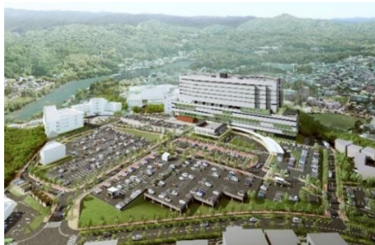
《トヨタ記念病院 全体イメージ》

健診センターは2024年7月（予定）に現在の場所にてリニューアルオープンいたします。検査エリアの拡充を図るとともに、健診内容、サービスの充実に向けてまいります。